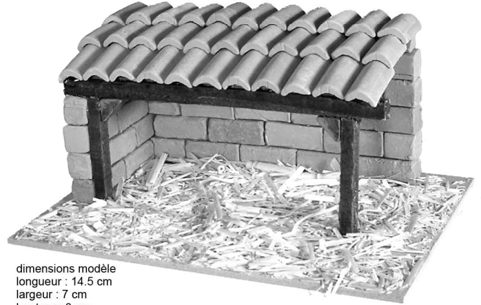
dimensions modèle longueur : 14.5 cm largeur : 7 cm hauteur : 8 cm

Le Santon Créatif 300 traverse de la Vallée 13400 Aubagne Tél. : 09.73.60.05.80