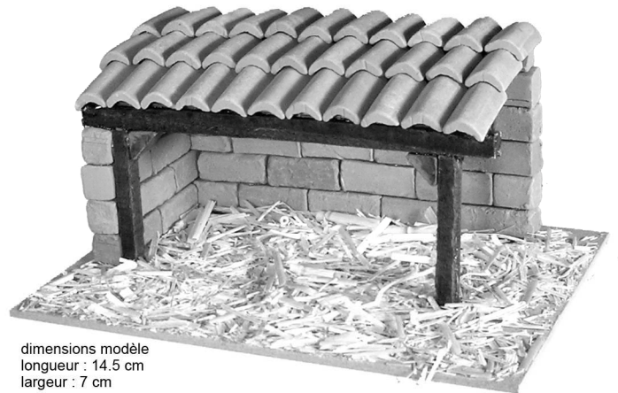
dimensions modèle longueur : 14.5 cm largeur : 7 cm hauteur : 8 cm

Le Santon Créatif 300 traverse de la Vallée 13400 Aubagne Tél. : 09.73.60.05.80